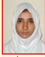
منیہا فاطمہ، نهم۔ (د)

نہج البلاغہ، امیر المؤمنین کے خطبات، مکتوبات اور اقوال پر مبنی کتاب ہے جس کا ہر لفظ لا جواب ہے لیکن کچھ اقوال مجھے بے حد پسند ہیں۔ جیسے ”جو حق سے ٹکرانے کا حق اُسے پھاڑ دے گا“، ایک اور جگہ ارشاد فرمایا کہ ”تقویٰ تمام خصلتوں کا سر تاج ہے“، حضرت علیؑ کے کچھ اقوال ایسے بھی ہیں جن سے ہمیں اپنی شخصیت کی تعمیر میں رہنمائی ملتی ہے۔ ”بات کرو تا کہ بچانے جاؤ؟“ اور ”لوگوں سے ان کے اخلاق و اطوار میں ہم رنگ ہونا ان کے شر سے محفوظ ہو جانا ہے۔“ ہمیں چاہیے کہ اس کتاب کا مطالعہ کرتے رہیں تاکہ عملی طور پر خود بھی اس سے فائدہ اٹھائیں اور دوسروں کو بھی بتائیں۔